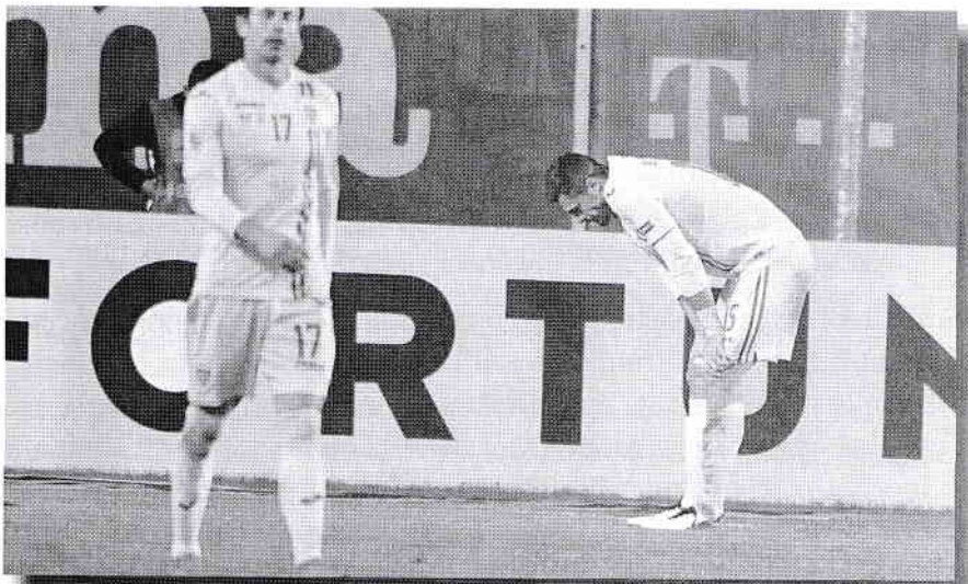
Efort zadarnic, imagine din partida România - Austria, 14.10.2020