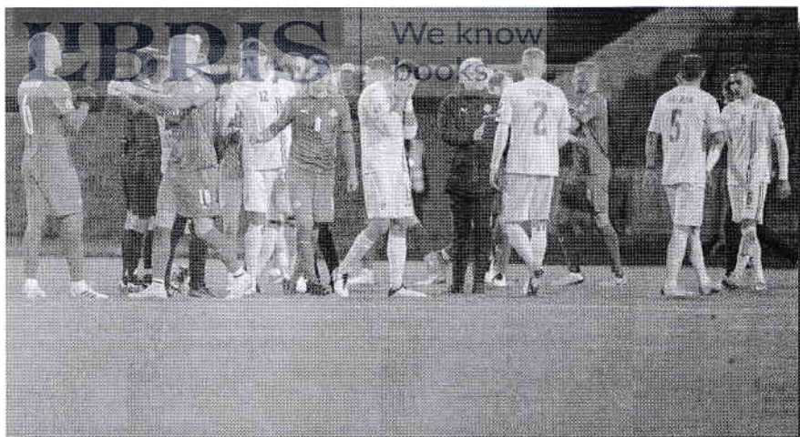
Imagine de final a meciului Islanda-România, 8.10.2020

2. 11 octombrie 2020: Norvegia - România 4-0 (2-0), Ullevaal, Oslo. Măcel, dezastru, final în genunchi. Poate că acest meci a venit prea repede după precedentul, dar programul nu se putea schimba. Mă așteptam să obținem ceva mai mult decât în capitala islandeză, dar a fost imposibil. Și cum despre un dezastru trebuie scris pe scurt, mă voi limita la câteva rânduri.